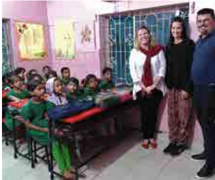
Les nouveaux bureaux

Et que dire de Montagut , seule société qui ait accepté de financer, depuis à présent cinq ans, presque la moitié du fonctionnement des Foyers - des repas des enfants aux salaires du personnel - comme fait à sa modeste échelle Un Amour de Café ... depuis bientôt 15 ans.